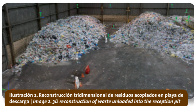
Ilustración 2. Reconstrucción tridimensional de residuos acopiados en playa de descarga | Image 2. 3D reconstruction of waste unloaded into the reception pit

In addition, a bale labeller is being developed to enable bales to be labelled automatically as soon as they are produced, making use of the signals that the baling press is capable of emitting. Thanks to the production management software and RFID technology incorporated into the attached label, it is possible to control the status and location of each bale in the plant, which affords real-time information on the status of the storage unit. This information will enable greater efficiency when requesting the dispatch of each of the materials, thereby preventing errors in orders and loading, amongst a number of other benefits. The information provided will be channelled by means of an app developed internally by Ecoembes. This app will enable the bales earmarked for dispatch to a recycler to be linked to the number plate of the vehicle responsible for the transportation.